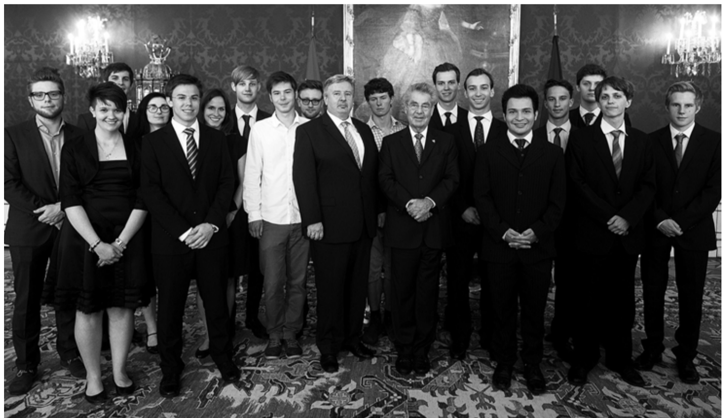
Empfang beim Bundespräsidenten zur Verabschiedung der Gedenkdienstleistenden des Jahrgangs 2014/2015 im Juli 2014. Im Bild: Dr. Heinz Fischer im Kreise der Gedenkdienstleistenden des Vereins GEDENKDIENTST und MitarbeiterInnen des Vereins.