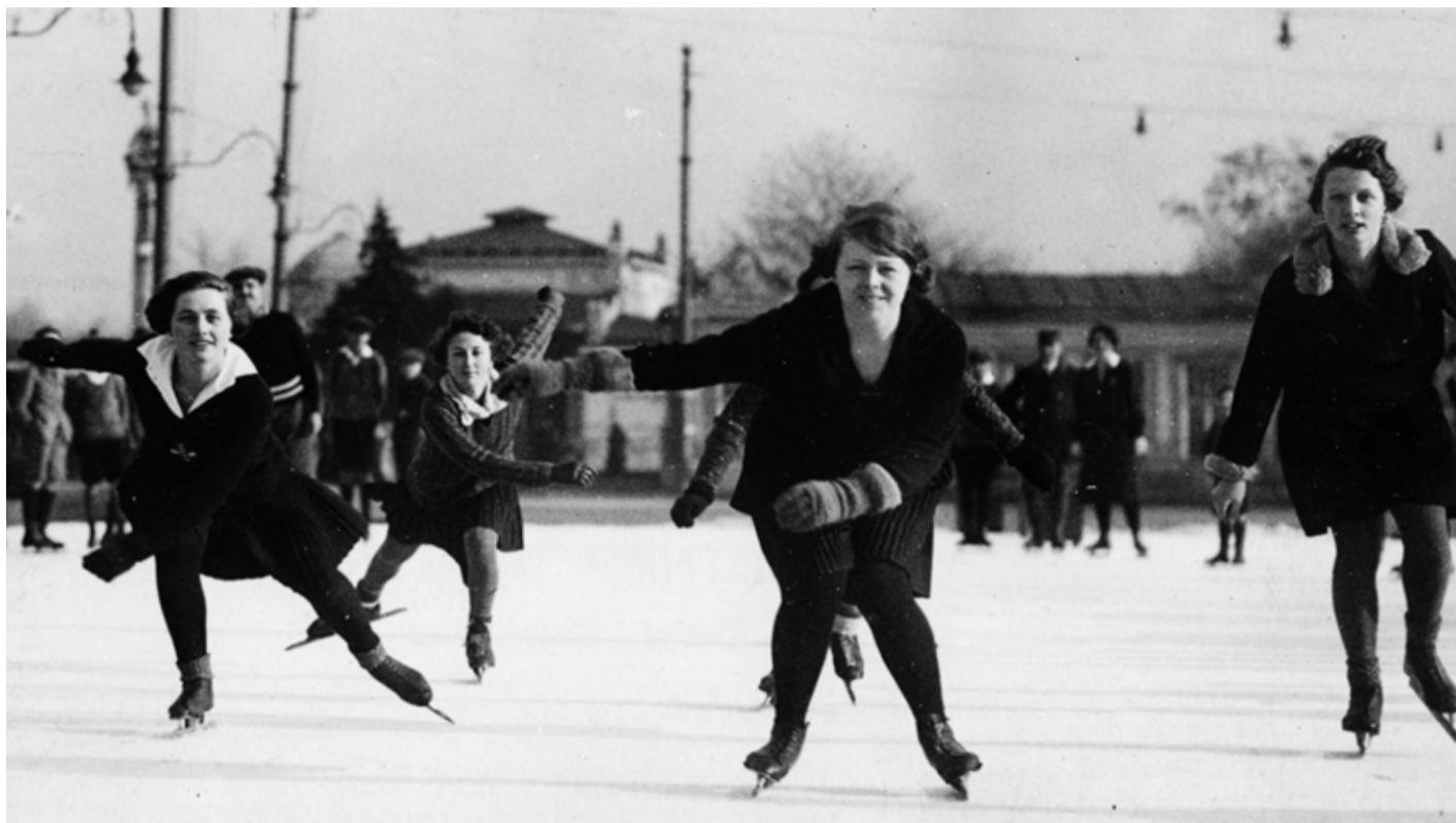
Eisschnellläuferinnen auf dem Platz des Wiener Eislauf-Vereins am Heumarkt, 1926

Der Verein GEDENKDIENTST veranstaltet jedes Semester die öffentliche Vortragsreihe Geh Denken! , in deren Rahmen wissenschaftliche Vorträge, Diskussionen und Zeitzeugnengespräche stattfinden. Ziel der Reihe ist es, ausgehend von der Geschichte des Nationalsozialismus, die Beschäftigung mit Vergangenheitspolitik und Gedächtniskultur anzuregen. Im Sommersemester wurde mit dem Schwerpunkt Sportgeschichte(n) ein Fokus auf ein Themengebiet der österreichischen Zeitgeschichte gelegt, das bis dato nur marginal behandelt wurde. Im Mittelpunkt standen die Geschichten dreier traditionsreicher österreichischer Sportvereine des Österreichischen Gebirgsvereins , des Wiener Eislauf-Vereins und der SC Hakoah Wien .