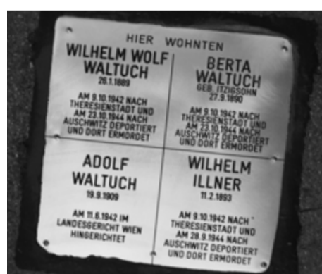
Die verlegten Erinnerungssteine für die Familie Waltuch an ihrem letzten freiwilligen Wohnort in der Favoritenstraße 12 in Wien